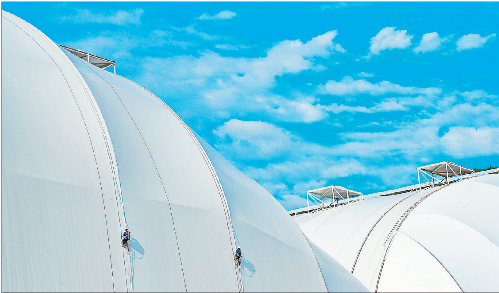
7月23日,四川省华蓥市物流园区高兴货场,建设者冒着高温在即将竣工的国家煤炭应急储备基地煤棚上紧张作业。该货场是目前川东渝北地区在建的发货量最大的综合性大型货场,涉及煤炭、建材、石油、冷链储运等行业。项目全部建成投运后将助力成渝地区双城经济圈建设。

23日当天,广东、云南、贵州超过157家电厂和用户达成南方区域首次跨省现货交易,全天市场化交易电量达27亿千瓦时。南方区域电力市场启动试运行后,中长期交易周期将全面覆盖年、月、周;现货交易将由广东拓展到广西、云南、贵州、海南,实现南方五省区的电力现货跨省交易;辅助服务市场的品种与补偿机制将进一步完善。预计今年全年,南方区域电力市场累计市场化交易电量将达到1.11万亿千瓦时,接近广东、云南、贵州三省2021年的全社会用电量总和。