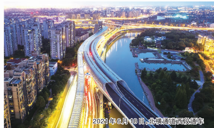
2021年6月18日,北横通道西段通车

30年来,上海城投的建设理念、技术手段和管理创新始终走在行业前沿。因地制宜创新实施“南隧北桥”方案,建设垂直高度632米的中国第一高楼,建成大型河口海岸水库的青草沙水源地、完成中心城区大规模保留保护建筑思南公馆的城市更新、开创新江湾城熟地开发、生活垃圾内河集装化运输、15.3平方公里的城市综合固废处置基地等,为行业提供了建设参考方案。