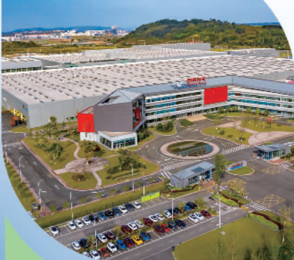
凯翼汽车智慧工厂

同时,四川矿石锂资源丰富,占全球6.1%、全国57%,在甘孜藏族自治州分布尤丰。宜宾与甘孜州建立了飞地园区,还联合宁德时代与甘孜签订了加快锂矿资源勘查开发的合作协议,为宜宾发展动力电池