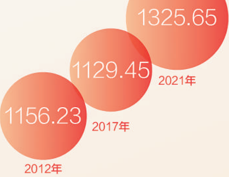
集装箱吞吐量（万标准箱）