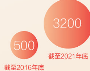
万人发明专利拥有量（件）