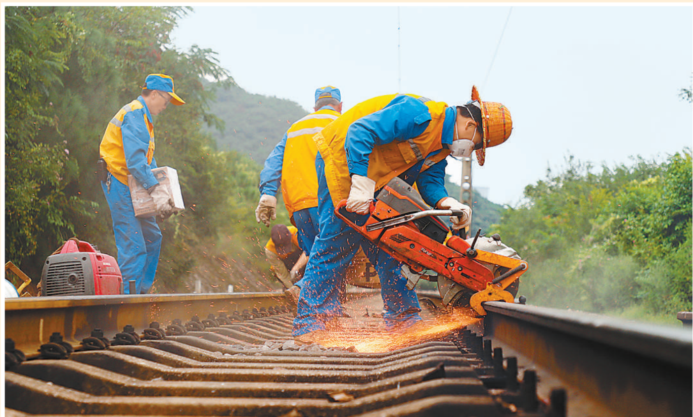
图①:中国铁路昆明局集团施工人员在成昆复线向尾至广通区间作业。