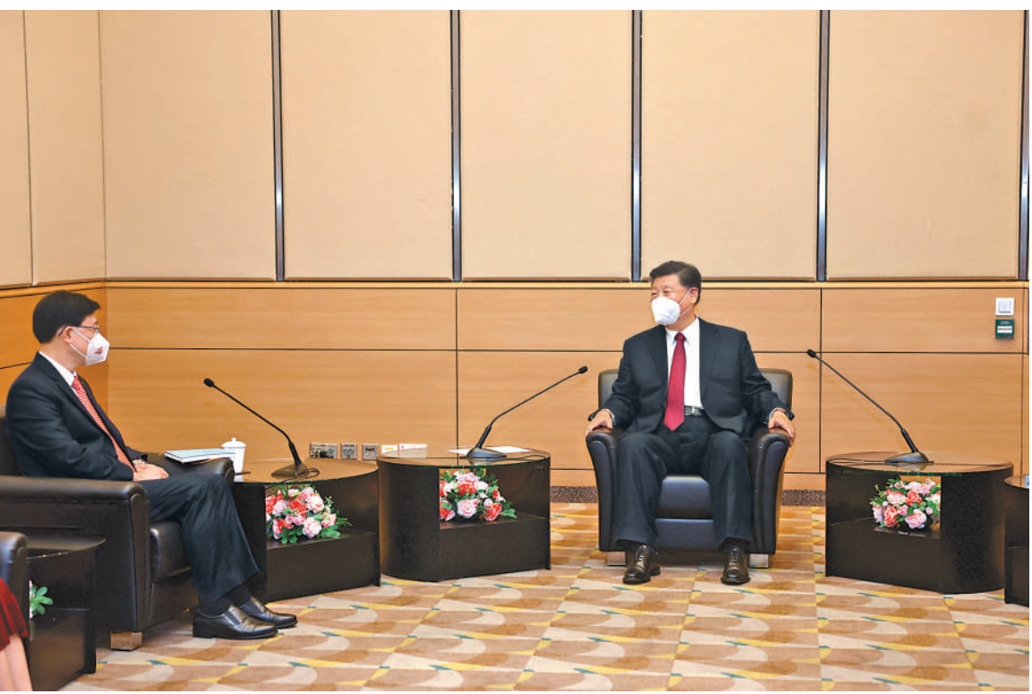
七月一日上午,国家主席习近平在香港会见刚刚就职的香港特别行政区行政长官李家超。