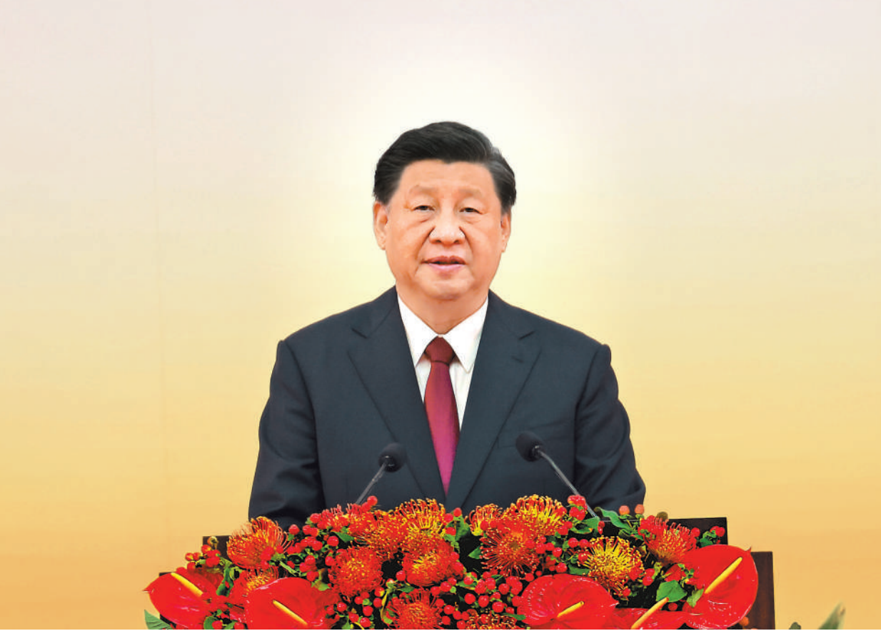
7月1日上午,庆祝香港回归祖国25周年大会暨香港特别行政区第六届政府就职典礼在香港会展中心隆重举行。中共中央总书记、国家主席、中央军委主席习近平出席并发表重要讲话。

习近平强调,25年来,在祖国全力支持下,在香港特别行政区政府和社会各界共同努力下,“一国两制”实践在香港取得举世公认的成功。“一国两制”是经过实践反复检验了的,符合国家、民族根本利益,符合香港、澳门根本利益,得到14亿多祖国人民鼎力支持,得到香港、澳门居民一致拥护,也得到国际社会普遍赞同。这样的好制度,没有任何理由改变,必须长期坚持