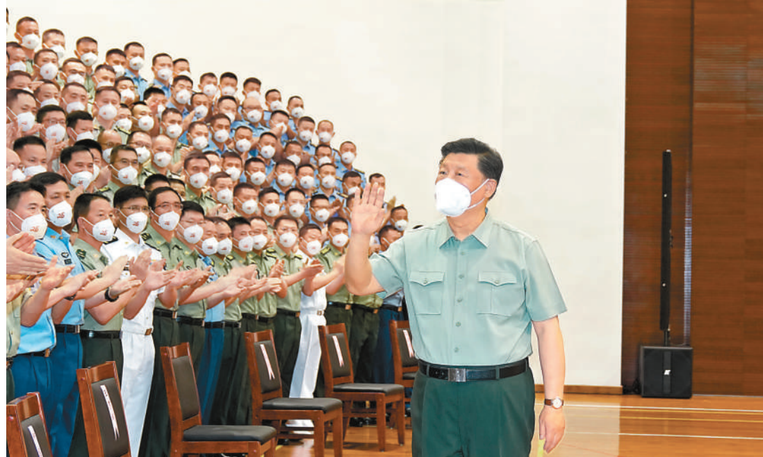
七月一日,中共中央总书记、国家主席、中央军委主席习近平视察了中国人民解放军驻香港部队,代表党中央和中央军委,向驻香港部队官兵致以诚挚的问候。这是习近平亲切接见驻香港部队官兵代表。