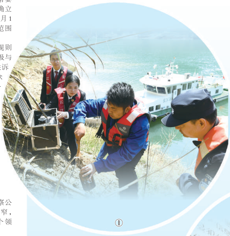
图①:湖北省宜昌市伍家岗区检察院公益诉讼办案组联合相关部门,在长江归江段查看污染土壤恢复情况。

近年来,检察机关以诉前检察建议的方式督促行政机关自我纠错、依法履职,确立“诉前实现保护公益目的是最佳司法状态”的目标追求。实践中,行政机关高度重视检察机关诉前检察建议,积极主动进行整改。2021年,行政机关诉前阶段回复整改率已从2018年的97.2%持续上升至99.49%。