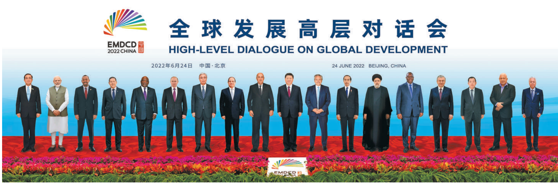
6月24日晚，国家主席习近平在北京以视频方式主持全球发展高层对话会并发表题为《构建高质量伙伴关系 共创全球发展新时代》的重要讲话。