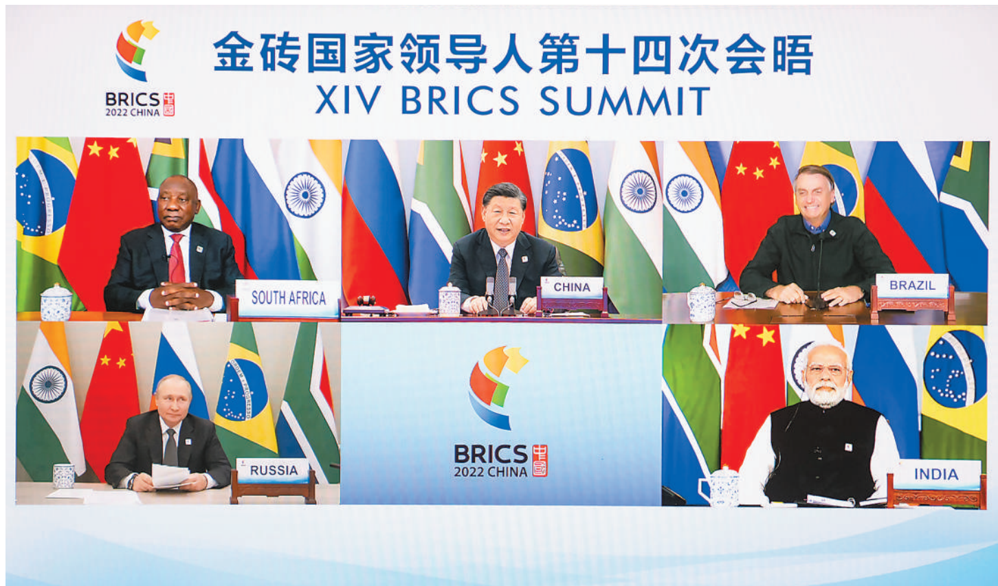
6月23日晚，国家主席习近平在北京以视频方式主持金砖国家领导人第十四次会晤并发表题为《构建高质量伙伴关系 开启金砖合作新征程》的重要讲话。南非总统拉马福萨、巴西总统博索纳罗、俄罗斯总统普京、印度总理莫迪出席。

新华社北京6月23日电（记者杨依军）国家主席习近平23日晚在北京以视频方式主持金砖国家领导人第十四次会晤。南非总统拉马福萨、巴西总统博索纳罗、俄罗斯总统普京、印度总理莫迪出席。