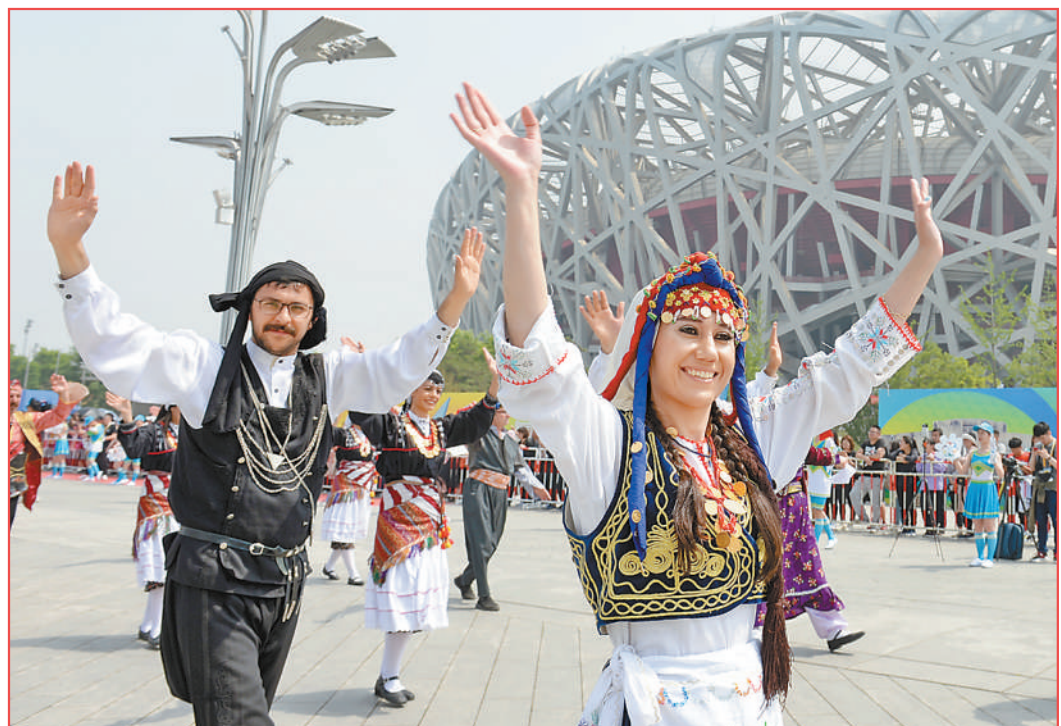
图①:2022年2月4日晚,第二十四届冬季奥林匹克运动会开幕式在北京国家体育场举行。图为焰火表演。 图②:中企承建的亚吉铁路是非洲第一条跨国电气化铁路,是中非共建“一带一路”的标志性项目。图为中方工作人员正在一对一培训埃塞俄比亚员工。 图③:2021年10月14日,工作人员在柬埔寨金边国际机场运输中国政府援助柬埔寨的科兴新冠疫苗。 图④:2019年5月16日,亚洲文明对话大会期间举办的亚洲文明巡游活动在北京奥林匹克公园庆典广场开幕,来自不同国家和地区的表演团队为人们带来了一场亚洲文化盛宴。 图⑤:2019年1月,在中国专家的指导下,布隆迪布班扎省吉航加县的农民取得水稻大丰收。 图⑥:2021年6月15日,中国海军第三十八批护航编队南京舰官兵在瞭望警戒。 图⑦:2022年6月2日,复兴号列车通过中老铁路南溪河特大桥。