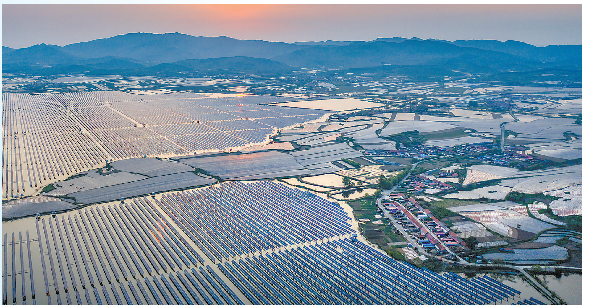
图⑥：辽宁省东港市康家坝水库光伏电站。