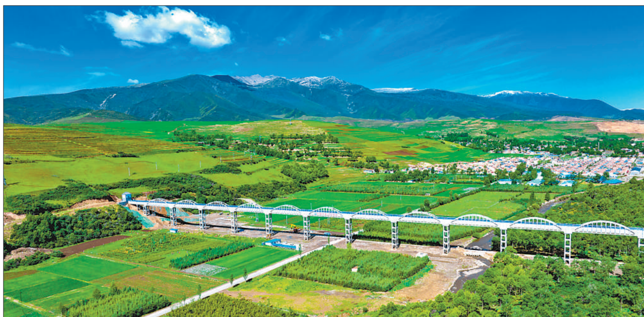
6月18日，青海省引大济湟水利工程主体建设项目进入收官阶段。引大济湟工程从青海省东北部大通河调水引入湟水河，建成后有效保障群众生产生活用水需求，助力青海生态保护和高质量发展。图为日前拍摄的引大济湟工程西干渠4号渡槽，全长1331米。

当前，全球疫情仍未得到有效控制，我国和世界经济发展面临的不确定性上升，风险挑战增多。在此背景下，我国吸收外资依旧保持了稳定增长，这充分说明我国在基础设施、人力资源、产业配套等方面依然拥有较强的综合比较优势，市场吸引力不减。