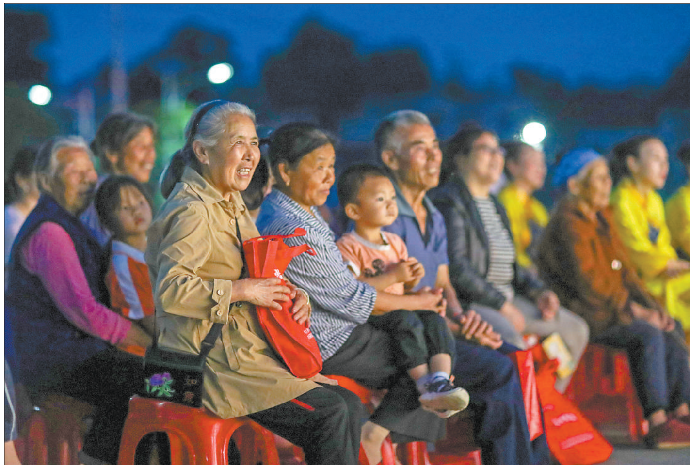
图①：安徽省宿州市砀山县积极推进文旅融合，助力乡村振兴。图为当地在果园组织戏曲表演，吸引游客观看。