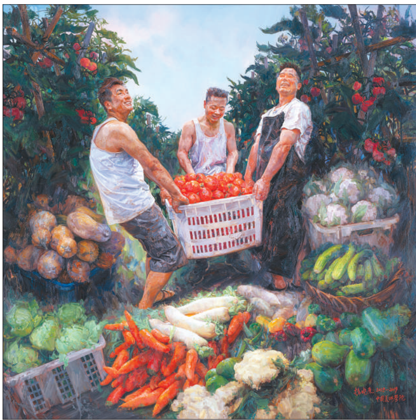
▼ 幸福的菜篮子(油画·局部)