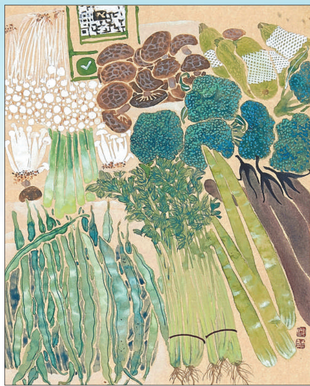
▲ 平淡生活(中国画·局部) 付小青