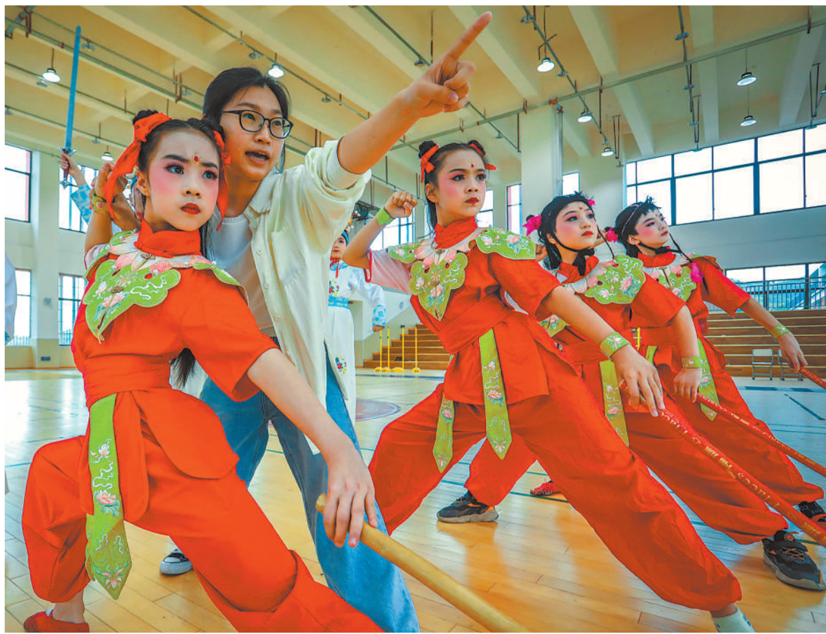
图①：江苏省南通市海安市教师发展中心附属小学，孩子们在老师指导下学习省级非遗“海安花鼓”。