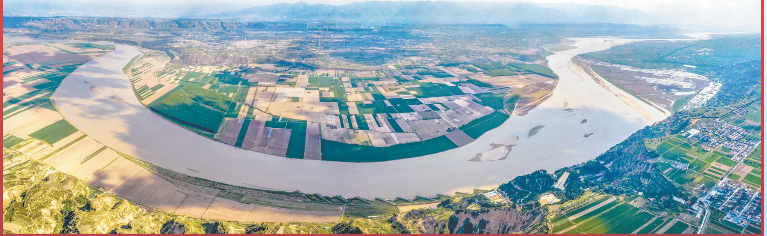
图⑤：黄河流经山西省运城市芮城县境内的黄土高原时，形成了别样的壮美景观。近年来，运城市扎实推进黄河大保护，发挥黄土高原水土保持的综合效益，带动农林牧渔等产业发展。