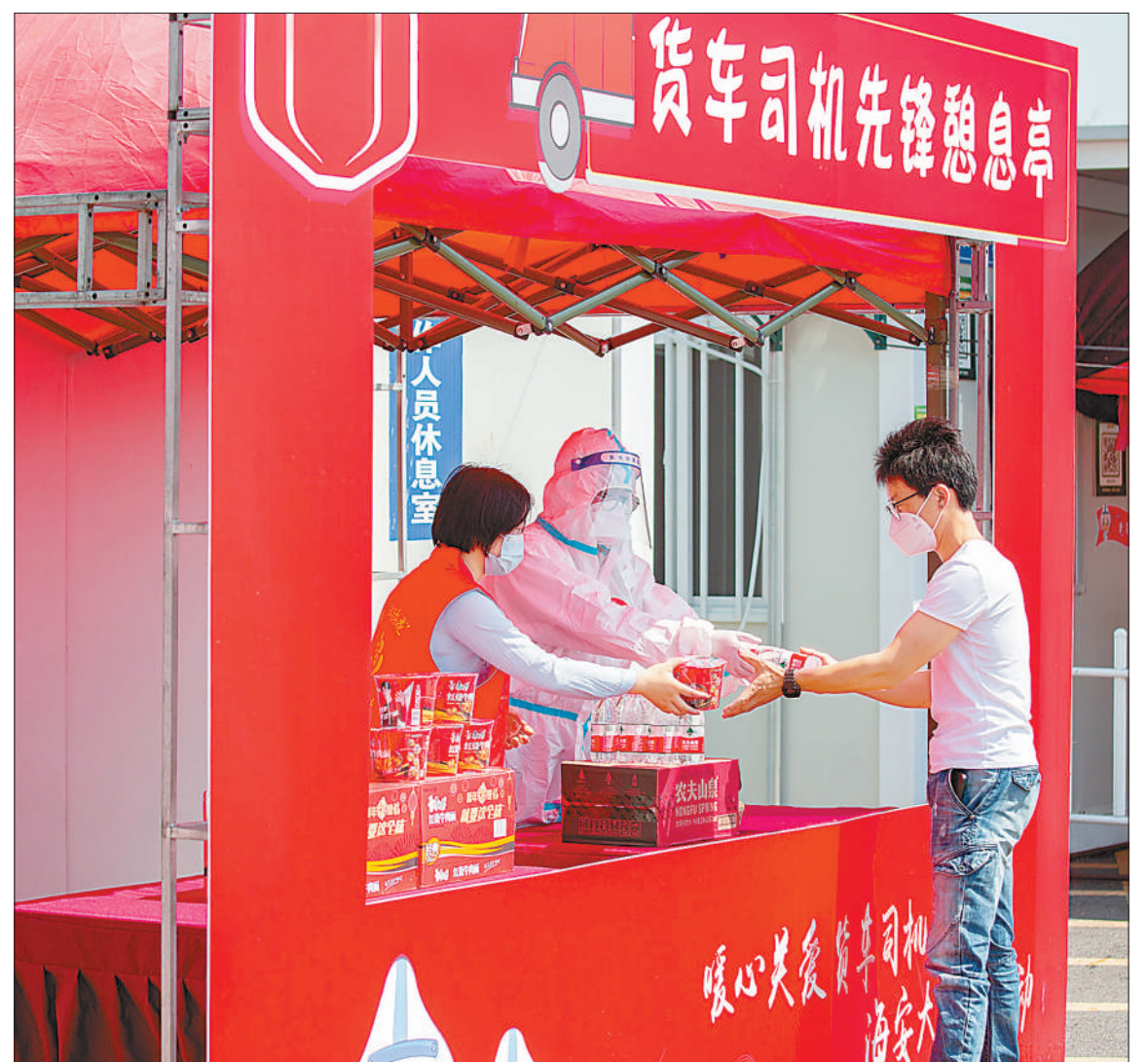
图①:重庆市涪陵区长江大桥螺旋匝道上,运输车辆来往不断。 图②:天津港货运物流畅通有序。 图③:内蒙古自治区呼和浩特市沙良物流园内,一列货运列车整装待发。 图④:沈海高速海安北出口,江苏省海安市大公馆党员志愿者为来往的货车司机及从业人员提供餐饮服务。 图⑤:一辆汽车奔跑在济广高速江西省赣州市宁都段。江西省宁都县各高速公路服务区通过有效的疫情防控措施,保障物流畅通。 图⑥:合淮阜高速公路淮南南出口,安徽省淮南市公安局交通执法人员在查验货车司机健康码和核酸检测阴性证明,引导货车优先通行。