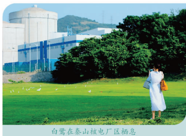
白鹭在泰山核电厂区栖息

共荣 发挥企业优势，赋能社会及更多伙伴，携手共建美丽家园，乐享和谐，促进共同繁荣富裕。