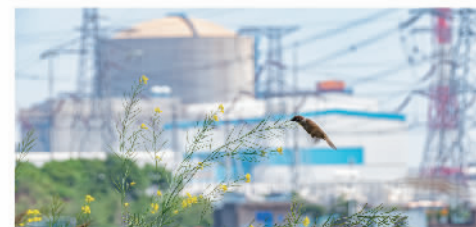
2022年举办中国核电首届“核谱之美”生物多样性保护实践摄影大赛，征集到高品质照片500多幅