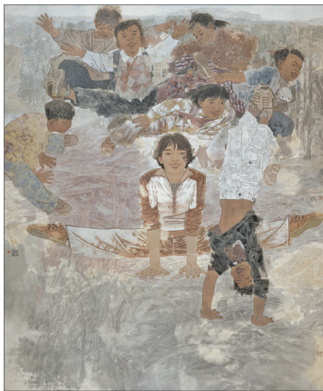
希望的田野(中国画)