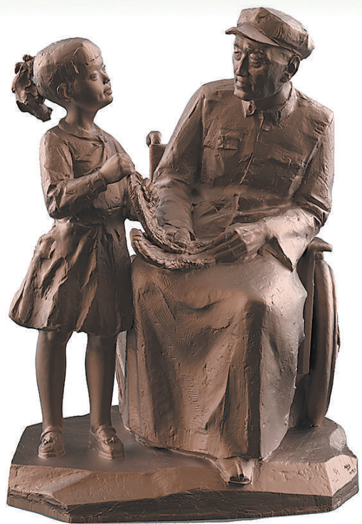
长征精神代代传(雕塑)