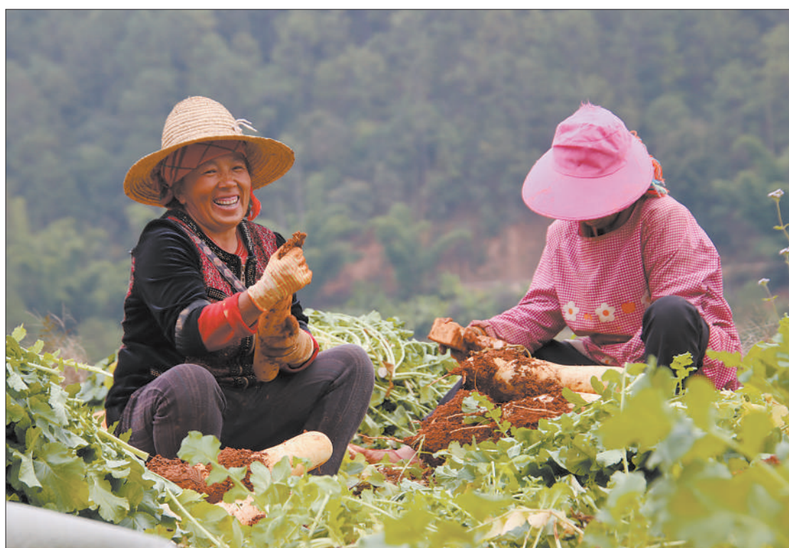
图①:贵州省安顺市西秀区,丰收的粮食即将入仓,农民露出幸福的笑容。