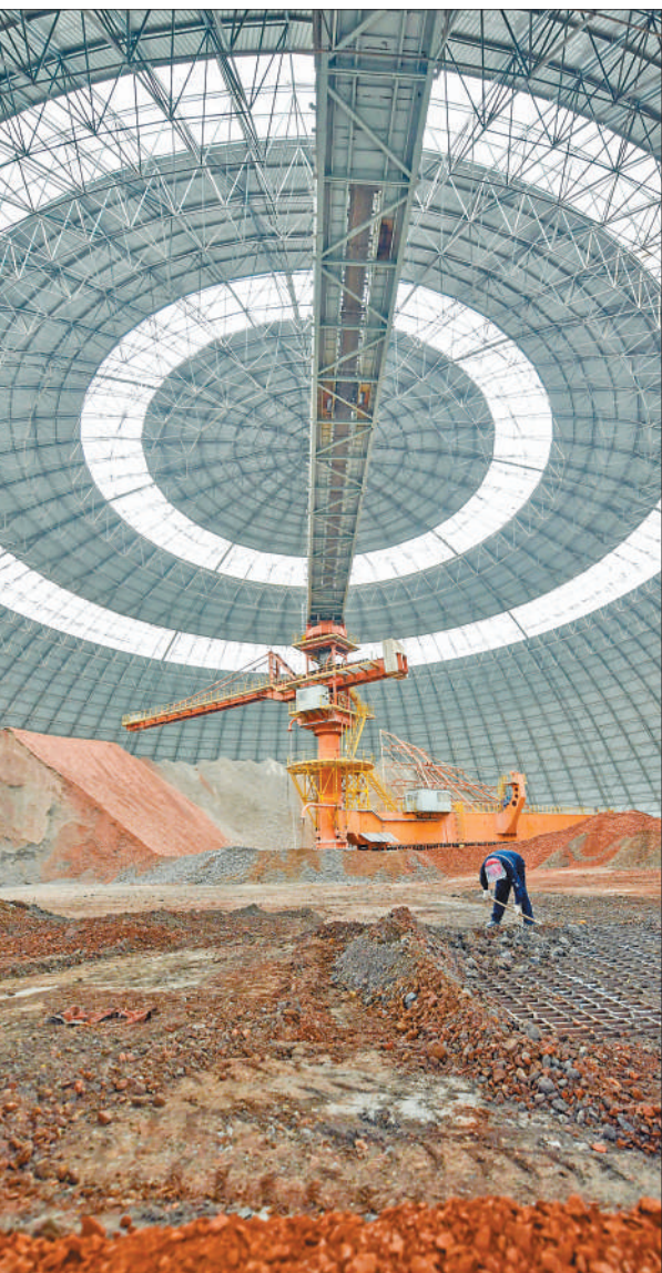
5月25日，贵州省遵义市务川仡佬族苗族自治县，务正道煤电铝循环经济工业园区，工人在生产车间工作。

4月末，国有企业资产负债率64.5%，上升0.2个百分点，中央企业67.0%，上升0.2个百分点，地方国有企业63.2%，上升0.2个百分点。