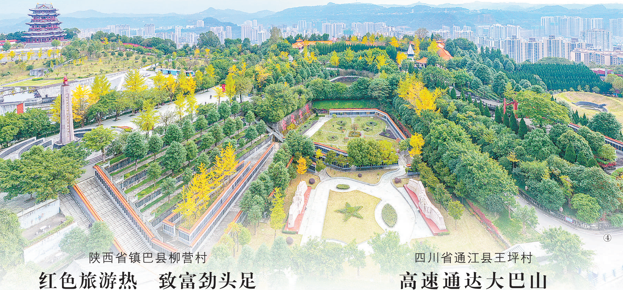
陕西省镇巴县柳营村