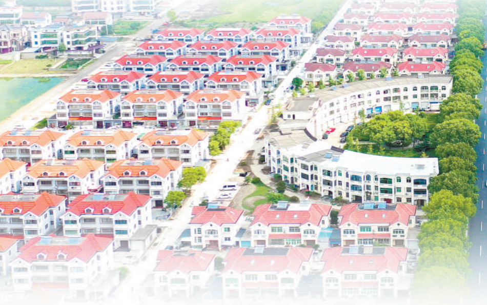
高质量发展建设共同富裕示范区

当前，我国发展不平衡不充分问题仍然突出，城乡区域发展和收入分配差距较大，各地区推动共同富裕的基础和条件不尽相同，促进全体人民共同富裕不可能一蹴而就，也不可能齐头并进，在实现路径上需要选取部分地区先行先试、作出示范。2021年5月，《中共中央国务院关于支持浙江高质量发展建设共同富裕示范区的意见》印发实施。支持浙江高质量发展建设共同富裕示范区，体现了以习近平同志为核心的党中央扎实推动共同富裕的方法论智慧，是党中央赋予浙江的光荣使命。一年以来，从初步构建共同富裕的目标体系、工作体系、政策体系、评价体系，到聚焦“七个先行示范”跑道，努力探索一批共同富裕的机制性新模式，再到努力开拓共性问题的破解之道、引领变革的先行之路，浙江在探索建设共同富裕示范区内迈出坚实步伐，以“浙江之窗”展现“中国之治”，努力探索破解新时代社会主要矛盾的有效途径，为全国扎实推动共同富裕提供可借鉴、可复制的省域经验。 从全国范围来看，促进共同富裕是一个长期的历史过程，要稳步朝着这个目标迈进。各个地方实际情况各异、发展水平不同，需要统筹考虑需要和可能，因时因地因地制宜设定发展目标、作出政策设计，按照经济社会发展规律循序渐进。既要有长远眼光，也要有务实行动；既要有共性目标，也要有个性路径。以浙江共同富裕示范区经验为借鉴，结合本地实际，既做大蛋糕也分好蛋糕，自觉主动解决地区差距、城乡差距、收入差距等问题，让发展成果更多更公平惠及全体人民，才能兼顾效率和公平，在实现高质量发展的过程中扎实推动共同富裕，让人民群众真真切切感受到共同富裕不仅仅是一个口号，而是看得见、摸得着、真实可感的事实。 道阻且长，行则将至，行而不辍，则未来可期。扎实推动共同富裕，不仅是一个光荣使命，而且是一个重大发展机遇；不仅是一项开创性的事业，更是一场系统性变革。有坚定不移的目标，有稳中求进的路径，有水滴石穿的韧性，一件事情接着办、一年接着一年干，共同富裕的美好图景必将变为现实。