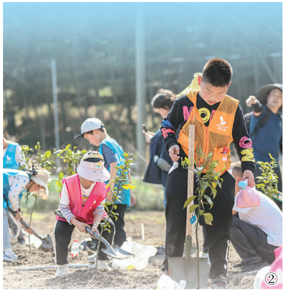
图①：浙江省杭州市萧山区梅林村俯瞰。 图②：浙江省绍兴市越城区金溪村的青少年在研学游基地植树，绿化环境。