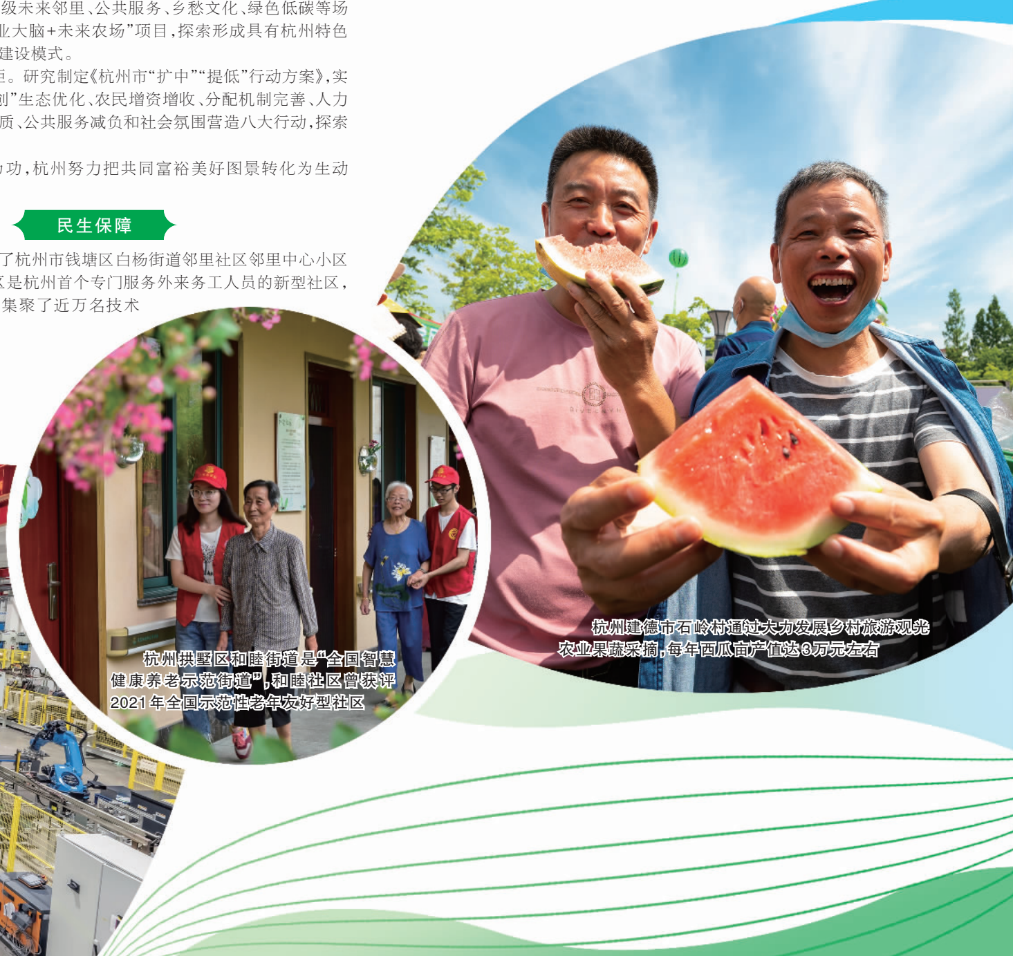
杭州建德市石岭村通过大力发展乡村旅游观光农业果蔬采摘,每年西瓜产值达3万元左右