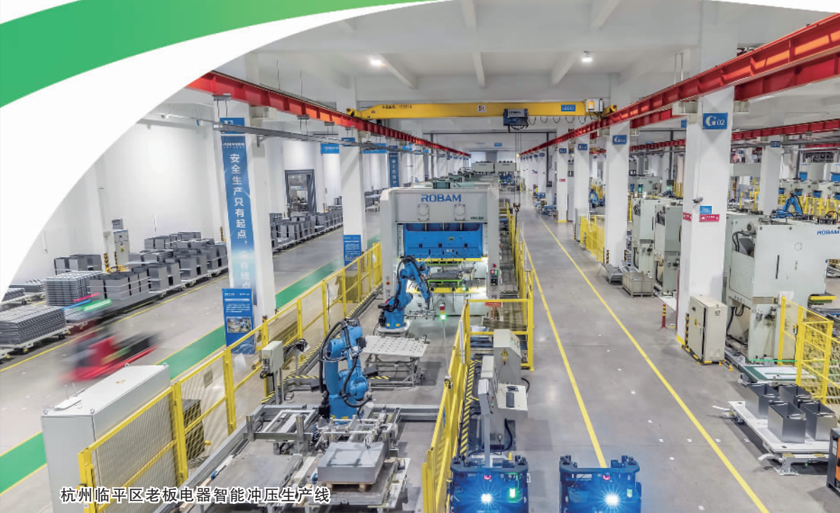
杭州临平区老板电器智能冲压生产线