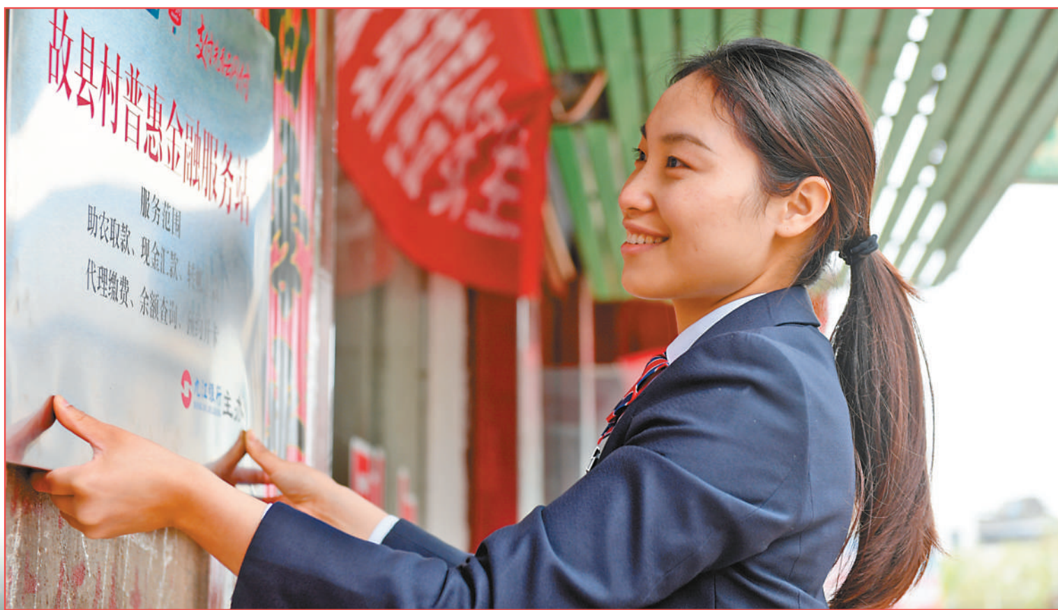
图①:浙江省嵊州市,邮储银行工作人员(左一、左二)在一家智能厨电制造企业了解生产经营情况,提供金融咨询。 图②:四川省南充市顺庆区,在川渝柑橘种业现代产业园项目建设现场,工商银行工作人员在宣讲金融政策。 图③:湖北省襄阳市,创业者(左)在市民服务中心办理创业担保贷款。襄阳市劳动就业管理局充分发挥创业担保贷款作用,缓解个人和小微企业融资难融资贵问题。 图④:江西省丰城市,九江银行工作人员在石滩镇故县村悬挂普惠金融服务站牌匾。该行已在当地多个乡镇设置了普惠金融服务站,让群众在家门口就能享受到便捷金融服务。 图⑤:湖南省娄底市双峰县,双峰农商银行工作人员将金融服务送到田间地头。

本版策划:沈寅 林琳 本版责编:白之羽 吕中正 韩春瑶 栾心怡 数据来源:中国人民银行 版式设计:汪哲平 张丹峰