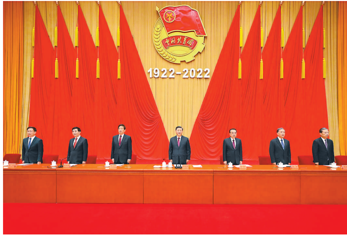
5月10日,庆祝中国共产主义青年团成立100周年大会在北京人民大会堂隆重举行。习近平、李克强、栗战书、汪洋、王沪宁、赵乐际、韩正等出席大会。

本报北京5月10日电 庆祝中国共产主义青年团成立100周年大会10日上午在北京人民大会堂隆重举行。中共中央总书记、国家主席、中央军委主席习近平在会上发表重要讲话强调,青春孕育无限希望,青年创造美好明天。新时代的中国青年,生逢其时、重任在肩,施展才干的舞台无比广阔,实现梦想的前景无比光明。实现中国梦是一场历史接力赛,当代青年要在实现民族复兴的赛道上奋勇争先。共青团要牢牢把握培养社会主义建设者和接班人的根本任务,坚持为党育人、自觉担当尽责、心系广大青年、勇于自我革命,团结带领广大团员青年成长为有理想、敢担当、能吃苦、肯奋斗的新时代好青年,用青春的能动力和创造力激荡起民族复兴的澎湃春潮,用青春的智慧和汗水打拼出一个更加美好的中国。