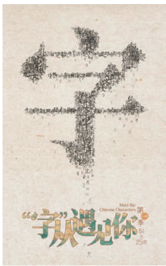
图为纪录片《字从遇见你》海报。