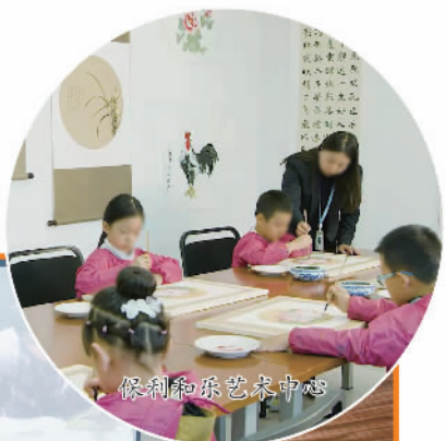
保利和乐艺术中心

保利发展控股多措并举投身乡村振兴,积极参与乡村治理,发展乡村产业,助力农民就业,投入总金额约2078万元 探索乡镇治理模式 | 搭建政府、企业、服务对象“三维一体”共联共建平台;连续举办三届“中国镇长论坛”,探索新型城镇化公共服务管理模式 以人才振兴助推乡村振兴 | 延续“星火计划”,继续承办“保利星火班”,“培训+就业”定点帮扶、精准援助,夯实乡村振兴人才基础 开展文体公益活动 | 升级美好沃土公益计划,将“和基金”打造为更开放的公益资源平台;持续推进“十元计划”“梦想艺术课堂”等公益活动,在26个省区市持续运营43间梦想艺术课堂,直接受益学生群体12000人