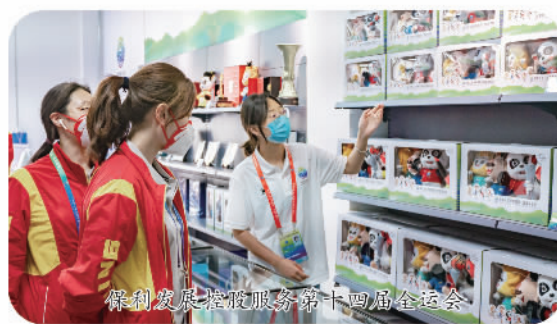
保利发展控股服务第十四届全运会

打造物业服务“软基建”!截至2021年末,保利物业进驻全国196个城市,在管项目总数1786个