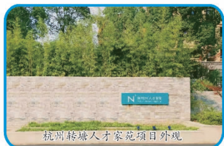
杭州转塘人才家苑项目外观

健康人居产品体系建设 | 构建“全生命周期居住系统2.0——Well集和社区”,不断升级迭代产品体系 积极参与保障性住房建设 | 截至2021年末,累计开发保障性住房项目172个 响应人才公寓政策 | 参与北京、上海、广州、武汉、杭州等全国20多个重点城市人才公寓项目建设 深耕城市建设项目 | 参与及跟进城市更新项目139个,涉及改造户数11万户;参与交通枢纽、文化设施和城市地标建设等公共基础设施项目