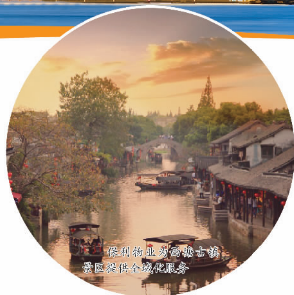
保利物业为高塘古镇景区提供全境化服务

稳步推进康养板块深度发展!打造“三维一体”健康养老模式,目前在营机构养老及社区养老项目累计14个,总床位数2433张