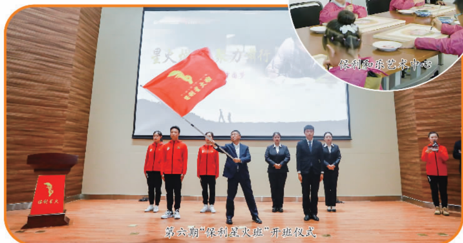
第六期“保利星火班”开班仪式