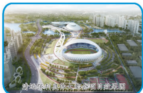
清远保利奥体大都会项目效果图