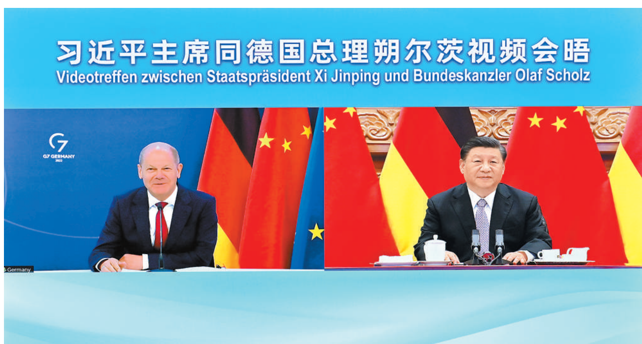
5月9日下午，国家主席习近平在北京同德国总理朔尔茨举行视频会晤。