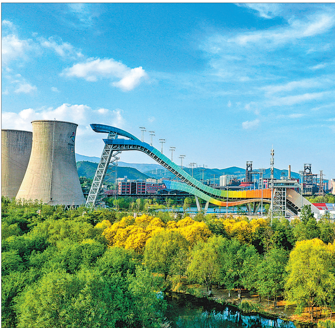
日前，北京冬奥公园与首钢园在高铁公园、冰雪森林和首钢大桥下3处节点实现互联互通，冬奥场馆、工业遗存、自然山水在这里实现融合。未来，这片区域将被打造成传承奥林匹克文化和体育精神的“体育+产业”示范区，为奥运场馆赛后利用积累经验。图为冬奥公园湿地与首钢滑雪大跳台。

据了解，青岛市三年攻坚行动共分为8个任务，既有老街区城市更新、低效工业园区和产业园区的再开发，也涉及1000多个老旧小区的环境改造和中心城区城中村改造。“三年攻坚行动将啃下不少硬骨头，对老城区进行修缮保护，将推动青岛的城市建设迈上新台阶。”青岛市委主要负责同志说。