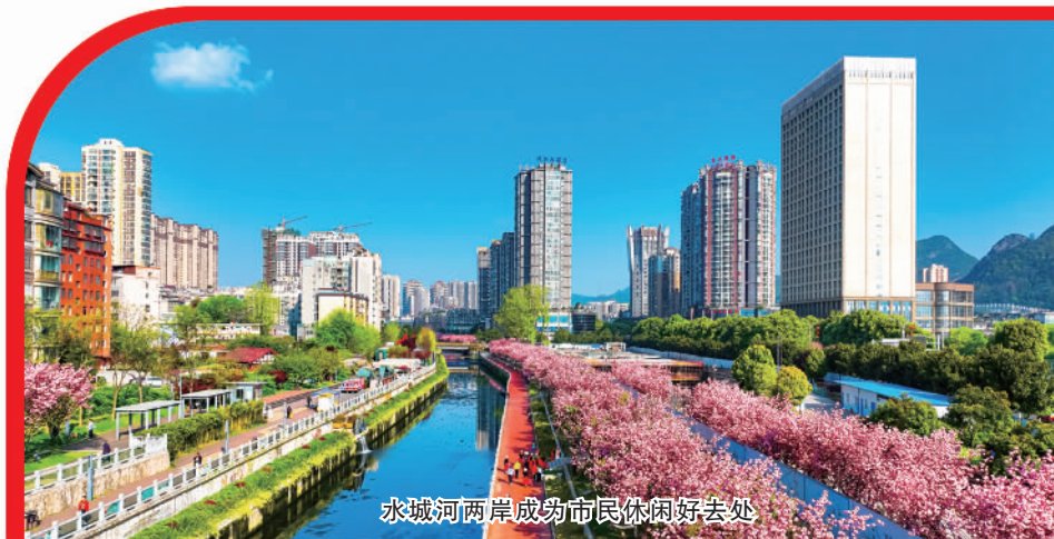
水城河两岸成市民休闲好去处

回首，是为了更好的出发。站在新的历史起点上，六盘水将抢抓发展机遇，把重大政策机遇转化为推动高质量发展和建设幸福六盘水的强大动能。坚持以高质量发展统揽全局，锐意开拓进取，加快建设物质生活富裕富足、精神文化自信自强、生活环境宜居宜业、社会氛围和谐和睦、公共服务普及普惠的幸福六盘水，奋力谱写幸福六盘水精彩篇章。