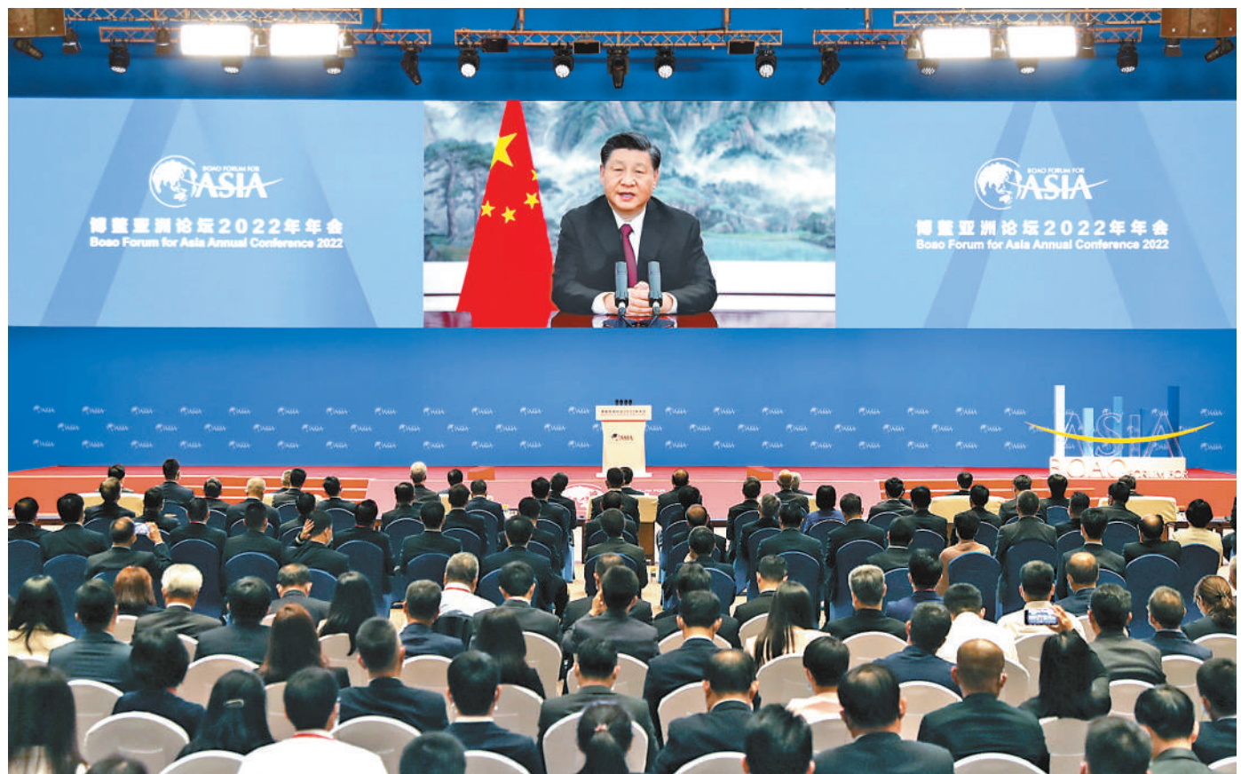
4月21日上午,博鳌亚洲论坛2022年年会开幕式在海南博鳌举行,国家主席习近平以视频方式发表题为《携手迎接挑战,合作开创未来》的主旨演讲。