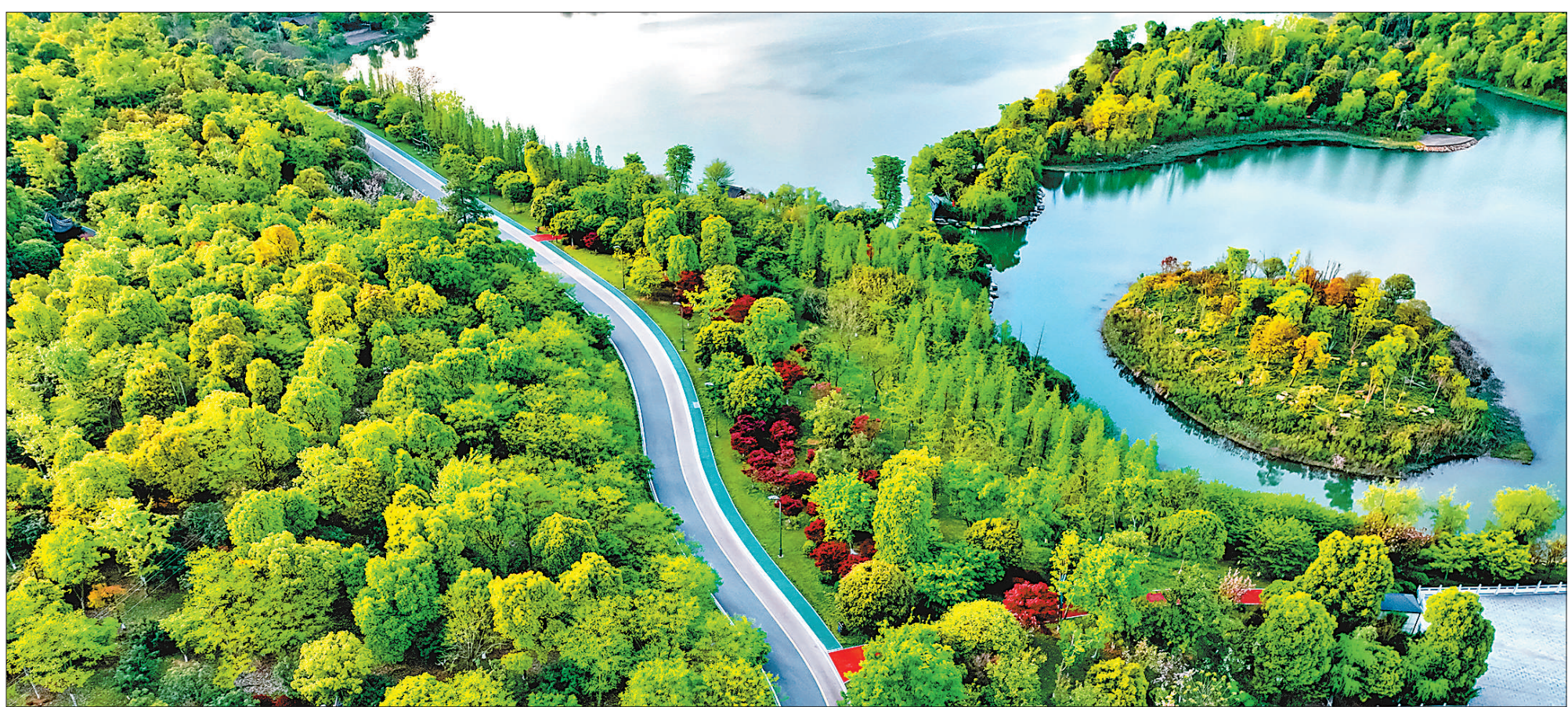
近年来,江西省萍乡市坚持生态优先、绿色发展,将治水与绿化相结合,修复城市水生态,提升城市品质。图为近日拍摄的萍乡市萍水湖湿地公园。

据了解,自2月10日云南九大高原湖泊保护治理民主监督工作启动以来,截至4月7日,已有4个民主党派先后派出调研组,对5处高原湖泊的保护治理工作开展民主监督。