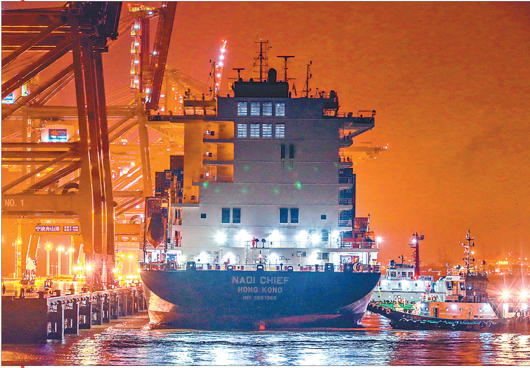
图①：河南郑州铁路集装箱中心站，X8203次中欧班列装载着出口货物开往波兰马拉舍维奇。 图②：第四届中国国际进口博览会消费品展区，一名工作人员在演示新品。 图③：宁波舟山港金塘港区大浦口集装箱码头，集装箱正在进行货物装卸作业。大浦口集装箱码头拥有25条国际航线，往来25个“一带一路”沿线国家和地区的41个主要港口。 图④：华晨宝马沈阳铁西工厂进行设备安装和调试。 图⑤：罗马尼亚阿利安索工业园内，海尔冰箱互联工厂正式投产。图为工厂车间内景。 图⑥：2021年中国国际服务贸易交易会综合展区，小朋友在和智能对话机器人互动。