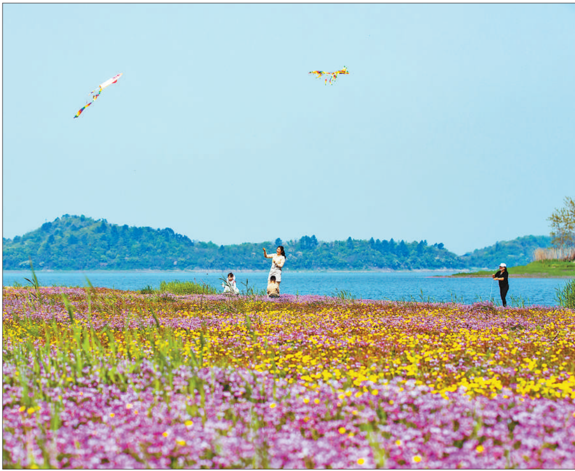
清明时节,气候宜人,草木越发苍翠,不少群众利用假期走出家门,赏花踏青,休闲健身。 上图:4月3日,江西省九江市湖口县,群众在内湖湿地踏青。 右图:4月3日,群众在福建省福州市金鸡山公园山地森林步道上漫步。