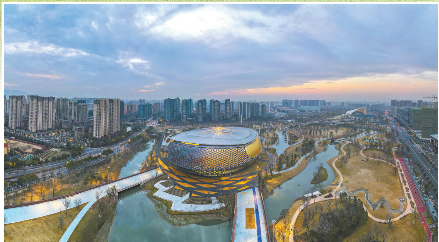
图①:临安体育文化会展中心体育馆为杭州亚运会跆拳道、摔跤项目比赛场馆,位于杭州市临安区锦南新城,总建筑面积约3.4万平方米,观众席位数3728个。