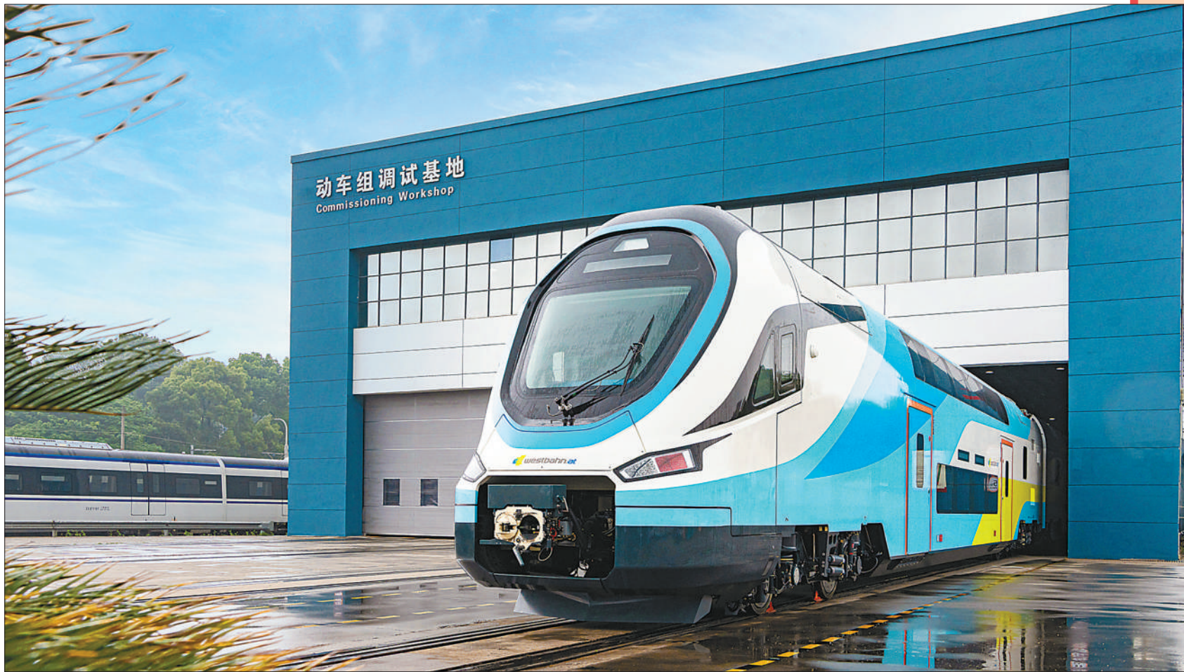
图①:重庆市綦江区,在北渡铝产业园一家公司的生产车间内,工人正赶制零部件。 图②:中国首列出口欧洲的双层动车组在位于湖南省株洲市的中车株机公司下线。 图③:全球首艘140米级打桩船“一航津桩”在振华重工江苏启东海洋工程码头正式交付。 图④:广东省佛山市顺德区,在中铁华隧联合重型装备有限公司生产车间内,工人正在组装盾构主机。 图⑤:在海南省海马汽车海口基地的焊装车间内,工人进行流水线作业。 图⑥:在河南省洛阳市中信重工车间内,工人忙着赶制矿山装备产品订单。