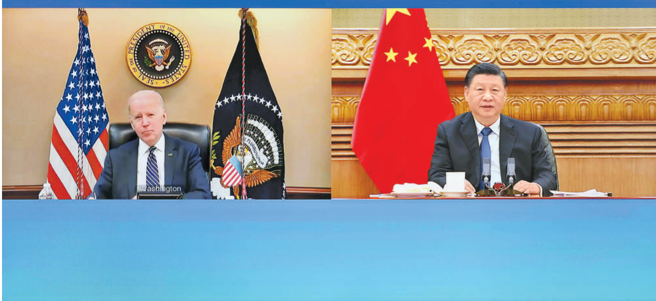
3月18日晚,国家主席习近平在北京应约同美国总统拜登视频通话。