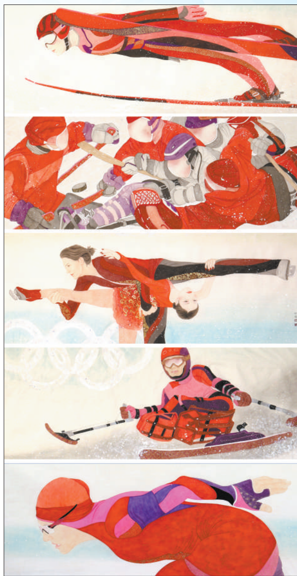
图①：速度与激情(中国画) 于文江 图②：追球(版画) 沙永江 图③：冰雪之炎(中国画) 师瑞 图④：2022冬奥·风采(中国画) 穆赛 傅明莉 图⑤：雪之舞(油画) 赵培智

分融合起来，使之超越单纯的视觉美感，直达精神的世界。师瑞中国画《冰雪之炎》便描绘了冰天雪地里燃烧的中国力量。作品将5个冰雪运动场景组合在一起，以工笔重彩技法加以描绘，并恰当运用传统勾金方式，通过红色与金粉的巧妙搭配，强化冰雪运动之美和赛场上青春飞扬的热度。