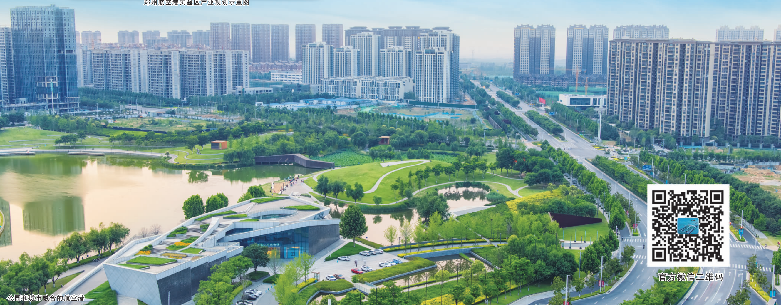
公园和城市融合的航空港