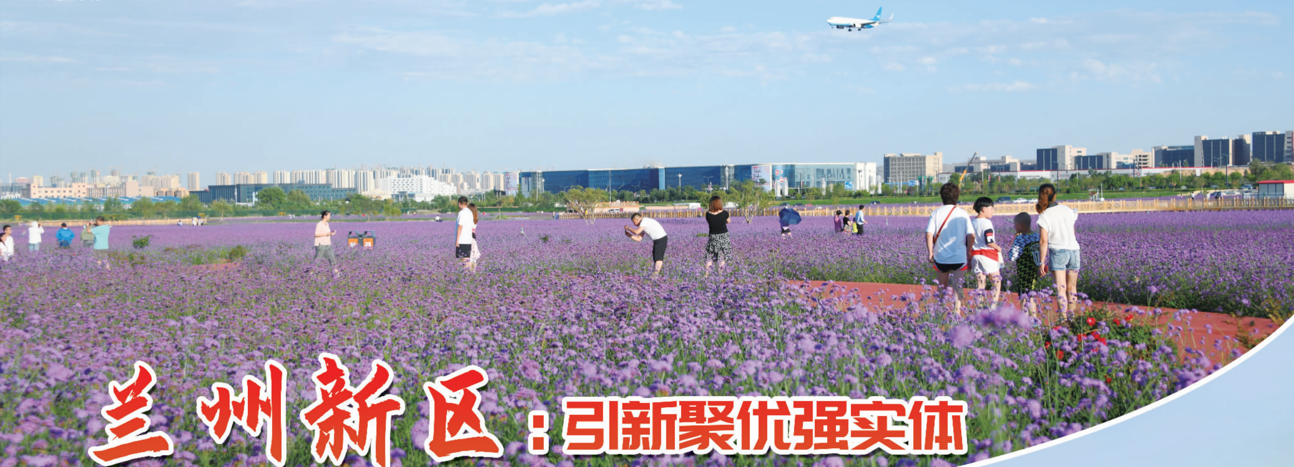
兰州新区临港花海