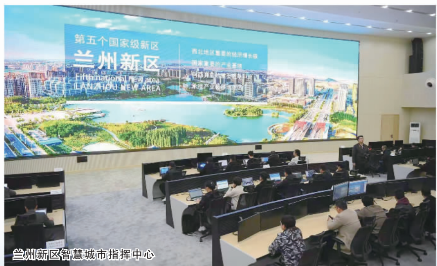
兰州新区智慧城市指挥中心

兰州新区牢牢把握东中部产业转移机遇，聚焦振兴“兰州制造”目标，大力实施“335+X”产业倍增行动，坚持集群化、规模化、链条化发展，构筑西部战略性新兴产业高地，引进产业项目860多个、总投资4600多亿元，逐步形成先进装备制造、绿色化工、新材料、大数据、新能源汽车、生物医药、商贸物流、文化旅游、现代农业、节能环保等优势产业集群，入选“国家新型工业化产业示范基地”。