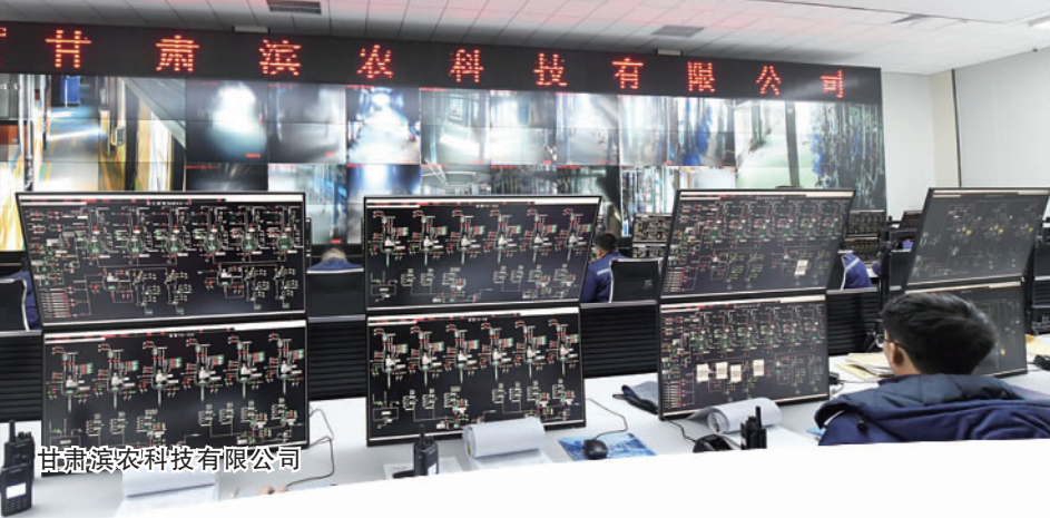
甘肃滨农科技有限公司