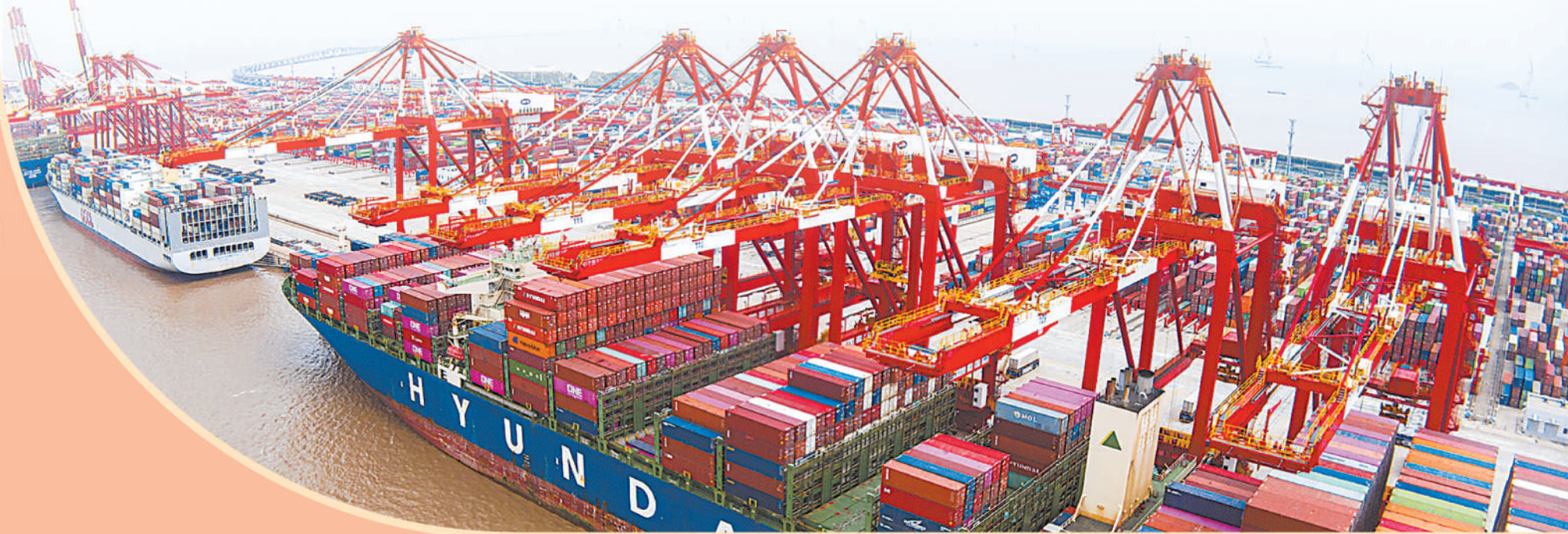
底图：上海洋山深水港自动化码头，多艘大型集装箱轮在进行集装箱装卸作业。