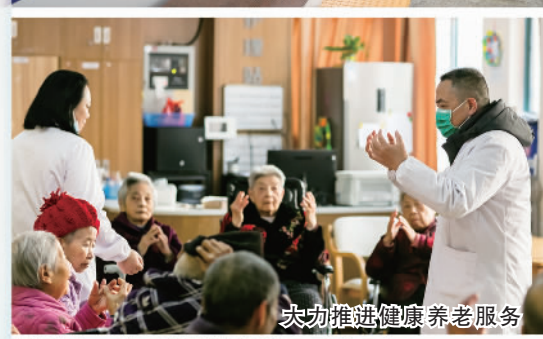
推动推进健康养老服务