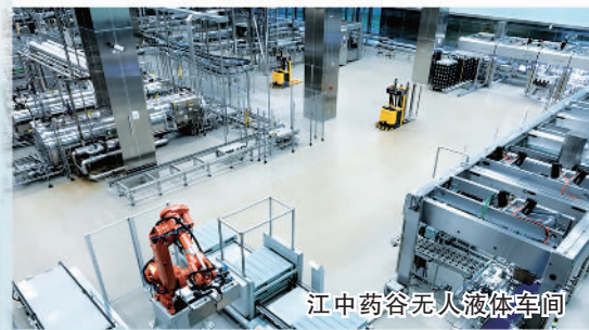
江中药谷无人液体车间