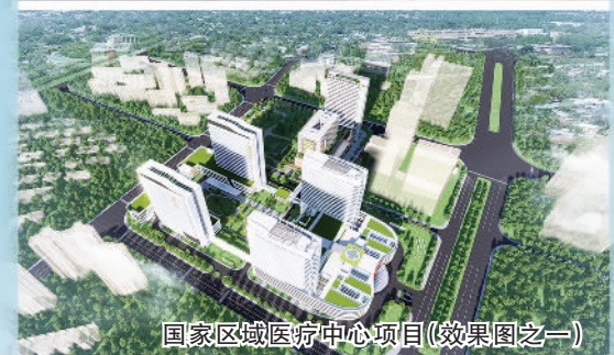
国家区域医疗中心项目(效果图之一)