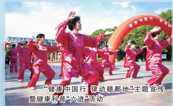
“健康中国行 律动赣鄱地”主题宣传暨健康科普“六进”活动