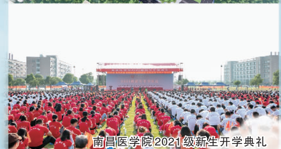
南昌医学院2021级新生开学典礼