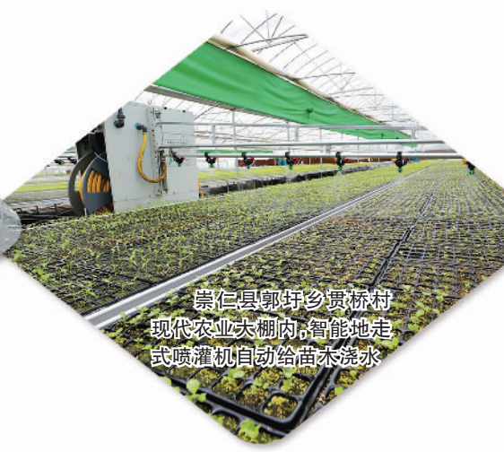
崇仁县郭乡贤村现代农业大棚内，智能地走式喷灌机自动给苗木浇水