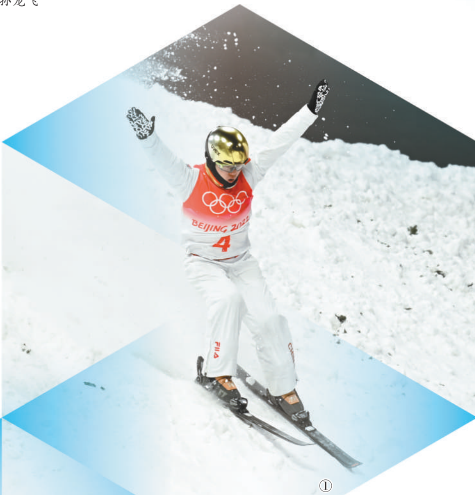
图①：2月16日，齐广璞在自由式滑雪男子空中技巧决赛中稳稳落地。

当日，北京冬奥会自由式滑雪空中技巧项目的比赛全部结束。中国队在女子和男子个人项目中分别摘得一金，在混合团体比赛中收获一枚银牌。