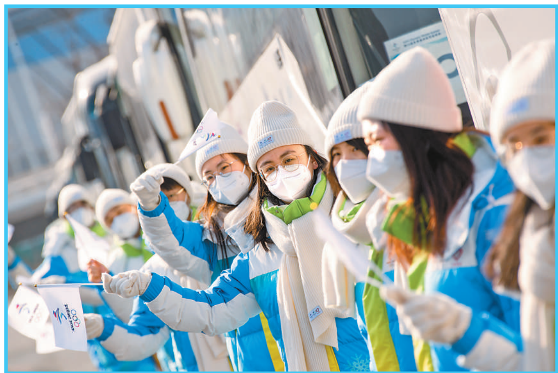
图①:2月4日,国际奥委会主席巴赫(右)在火炬传递前与志愿者交流。当日,北京冬奥会火炬在北京奥林匹克森林公园传递。 图②:2月9日,国家越野滑雪中心,一位冬奥会志愿者的睫毛上结出冰珠。 图③:2月10日,国家雪车雪橇中心,志愿者在选手出发后清理赛道。 图④:2月4日,在奥林匹克塔西侧的景观大道上,志愿者将醒目的导引标识贴在胸前。 图⑤:2月9日,在首钢滑雪大跳台进行的自由式滑雪男子大跳台比赛开始前,赛区志愿者迎接集体乘车前来的观众。 图⑥:2月11日,志愿者在张家口赛区为外国记者服务。