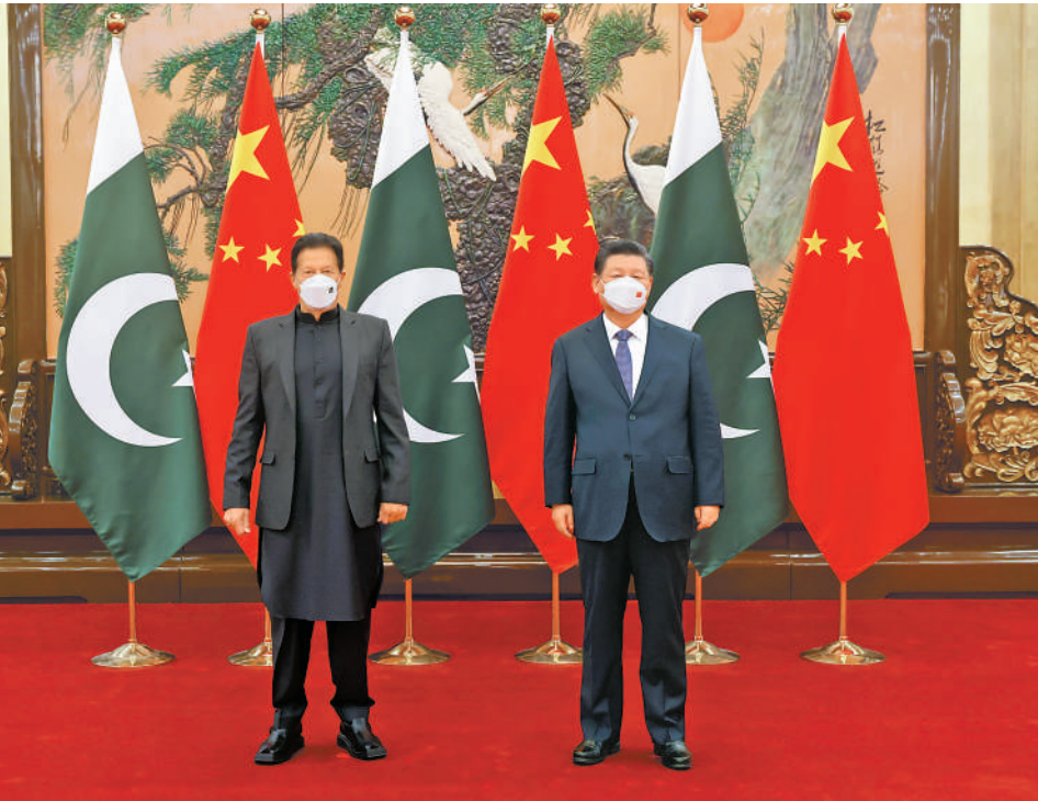
新华社北京2月6日电 国家主席习近平2月6日上午在人民大会堂会见来华出席北京2022年冬奥会开幕式的巴基斯坦总理伊姆兰·汗。习近平指出，刚刚过去的2021年对中亚关系意义非凡。两国庆祝建交70周年，回顾历史、总结经验，以更坚定的信心开创中巴关系未来。中方愿同巴方一道，加快构建新时代更加紧密的中巴命运共同体，为两国人民创造福祉，为地区合作提供动力。（下转第四版）