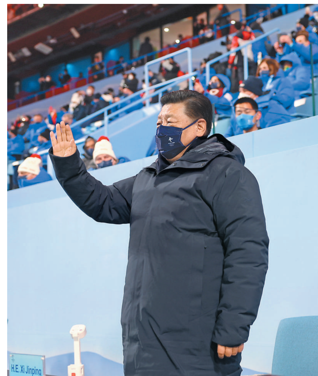
2月4日晚，北京第二十四届冬季奥林匹克运动会开幕式在国家体育场隆重举行。这是国家主席习近平在主席台上向大家挥手致意。

李克强栗战书汪洋王沪宁赵乐际韩正王岐山 国际奥委会主席巴赫 来自世界各地的领导人和贵宾等出席