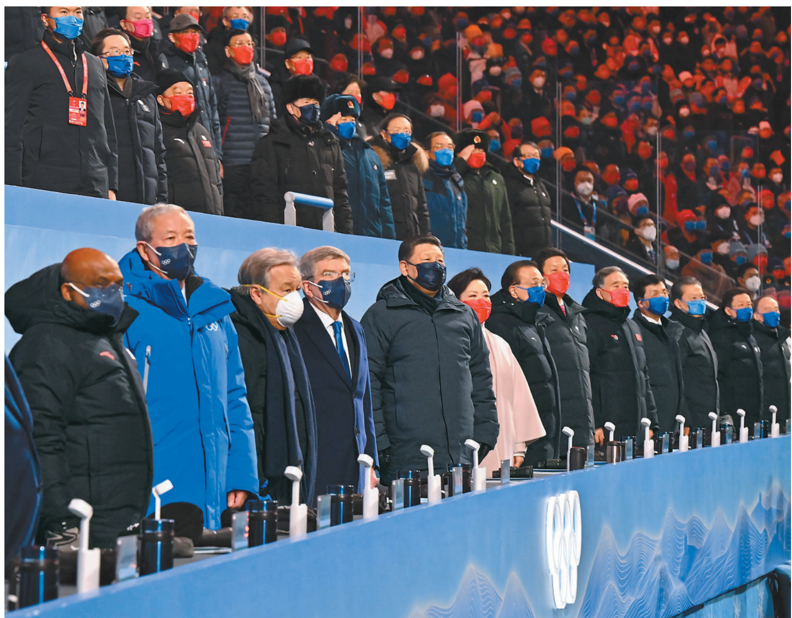
2月4日晚，北京第二十四届冬季奥林匹克运动会开幕式在国家体育场隆重举行。习近平、李克强、栗战书、汪洋、王沪宁、赵乐际、韩正、王岐山等党和国家领导人出席开幕式。

新华社北京2月4日电 筑梦冰雪，同向未来。2022年2月4日晚，举世瞩目的北京第二十四届冬季奥林匹克运动会开幕式在国家体育场隆重举行。国家主席习近平出席开幕式并宣布本届冬奥会开幕。中华文明与奥林匹克运动再度携手，奏响全人类团结、和平、友谊的华美乐章。