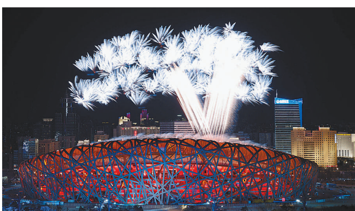
二月四日晚，第二十四届冬季奥林匹克运动会开幕式在北京国家体育场举行。这是焰火表演。