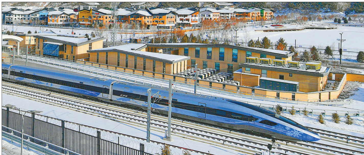
1月21日,涂装“瑞雪迎春”的冬奥列车驶过河北张家口崇礼太子城冰雪小镇。当日,冬奥列车开启赛事时运输服务。