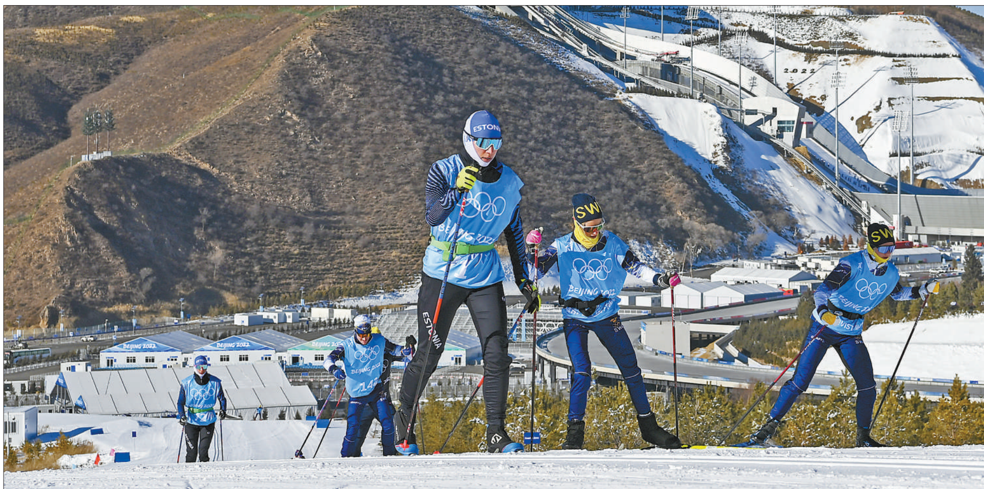
1月29日,运动员在国家越野滑雪中心训练。近日,北京冬奥会越野滑雪项目各参赛队伍在国家越野滑雪中心适应场地,熟悉赛道,备战日渐临近的比赛。

以“体育+”的方式改善区域面貌,让当地居民获得更多就业和发展机会,从冬奥筹办中实实在在受益,提升了群众的获得感和幸福感。