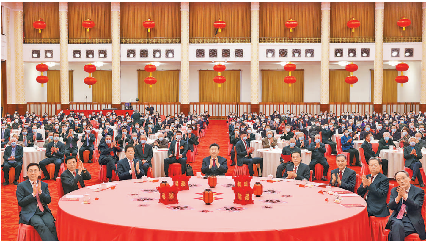
1月30日,中共中央、国务院在北京人民大会堂举行2022年春节团拜会。党和国家领导人习近平、李克强、栗战书、汪洋、王沪宁、赵乐际、韩正、王岐山等同首都各界人士欢聚一堂,共迎新春。